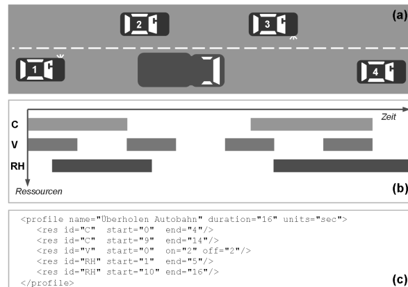
Abbildung 2: Beschreibung eines Ressourcenprofils am Beispiel "Überholen" als schematische Darstellung (a), als Gantt-Chart (b) und als XML-Beschreibung (c)

Fall), die Belegung der Ressource V (visuell) ist als wiederholt regelmäßige Belegung mit definierten Belegungs- und Freigabezeiten (dynamischer Fall erster Art) modelliert. Die Ressource RH (rechte Hand, motorisch) wird als eine Sequenz von Einzelbelegungen (dynamischer Fall zweiter Art) dargestellt.